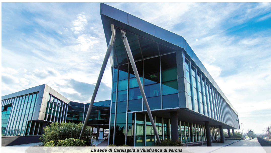
La sede di Careisgold a Villafranca di Verona

Con un capitale sociale interamente versato di 2 milioni di euro, il grande valore aggiunto che ha permesso a Careisgold di emergere rispetto